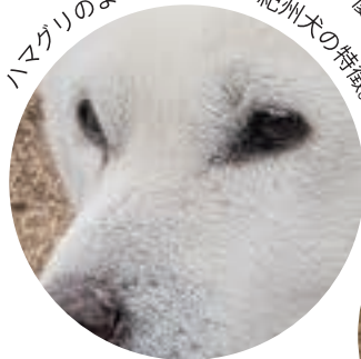
ハムグリのような目の形が紀州犬の特徴。