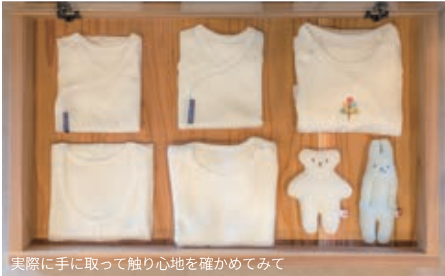
実際に手に取って触り心地を確認してみてください

時代とともに変わるお客さんからの声に応えるため、物作りも変化していきます。その中で大切にしているのは、誠実な物作り。「はやりが変わっても、うちのコットンを身に付けた人が『いいもの』であることを感じられる、そんな製品を届けたい」と、受け継いできた姿勢を話します。