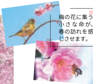
梅の花に集う小さな命が、春の訪れを感じさせます。