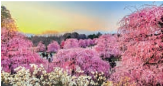
鈴鹿山脈を背景に、見晴らし台から。空の色が移ろう夕暮れ時がお勧め。

鹿山脈の麓に広がる「鈴鹿の森庭園」(鈴鹿市)。ここは日本の伝統園芸文化の一つ「しだれ梅の仕立て技術」を継承する研究栽培農園です。樹齢100年以上、日本最古とされる呉服しだれ「天の龍」はじめ、全国から集められた名木がそろった園内。歴史を受け継いだ約200本の木々は、日々の管理や剪定といった確かな技によって美しい姿が保たれています。