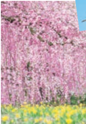
昼は陽光に包まれ、夜は闇に浮かぶ。時間帯ごとに印象が変わります。