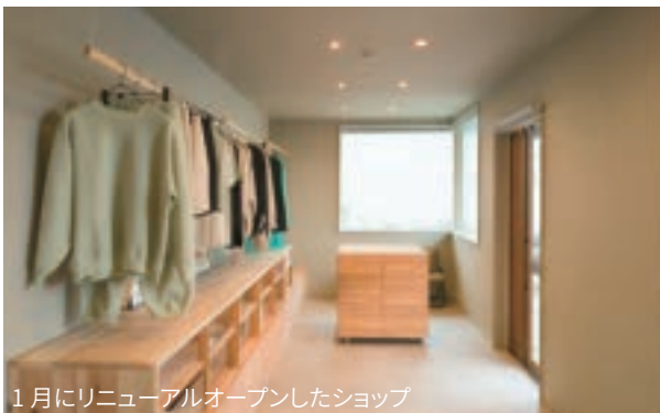
1月にリニューアルオープンしたショップ