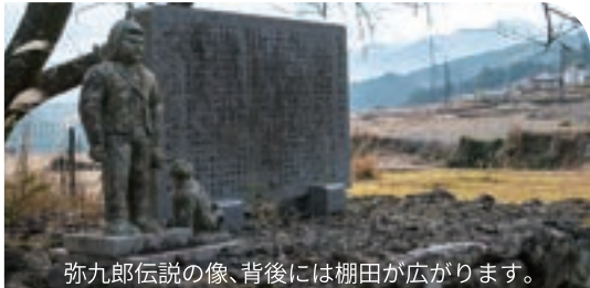
弥九郎伝説の像、背後には棚田が広がります。