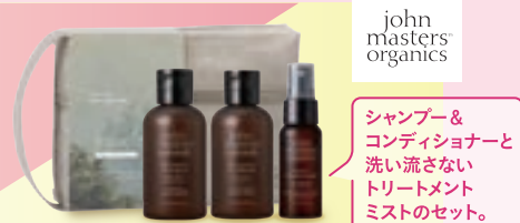
john masters organics シャンプー&コンディショナーと洗い流さないトリートメントミストのセット。

人気のヘアケア&スキンケアのミニサイズがセットに! 大切な人や自分へ、旬のケアをご提案します。