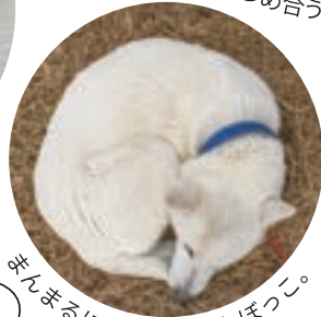
まんまるになってひなたぼっこ。