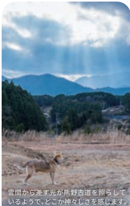
雲間から差す光が熊野古道を照らしているようで、どこか神々しさを感じます。