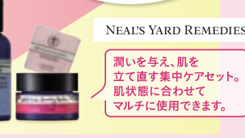
NEALS YARD REMEDIES 潤いを与え、肌を立て直す集中ケアセット。 肌状態に合わせてマルチに使用できます。

KIPS クレジットカードは +2% ポイント 現金専用 KIPSポイントカード (KIPSデジタルポイントカード) KIPS ICOCARDは +1% ポイント ※他の優待との併用はできません。