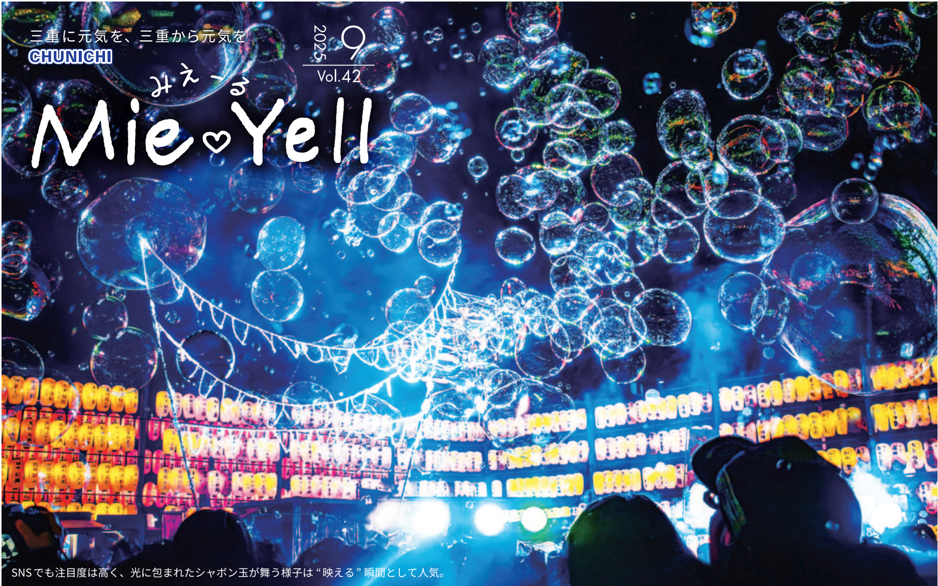
SNSでも注目度は高く、光に包まれたシャボン玉が舞う様子は“映える”瞬間として人気。

夜空に舞う無数の泡が、ライトに照らされてきらめく――。シャボン玉は「子どもの遊び」というイメージを大きく変えるナイトバブルショーがいま、子どもから大人まで幅広い世代を魅了し、新たなエンターテインメントとして注目を集めています。