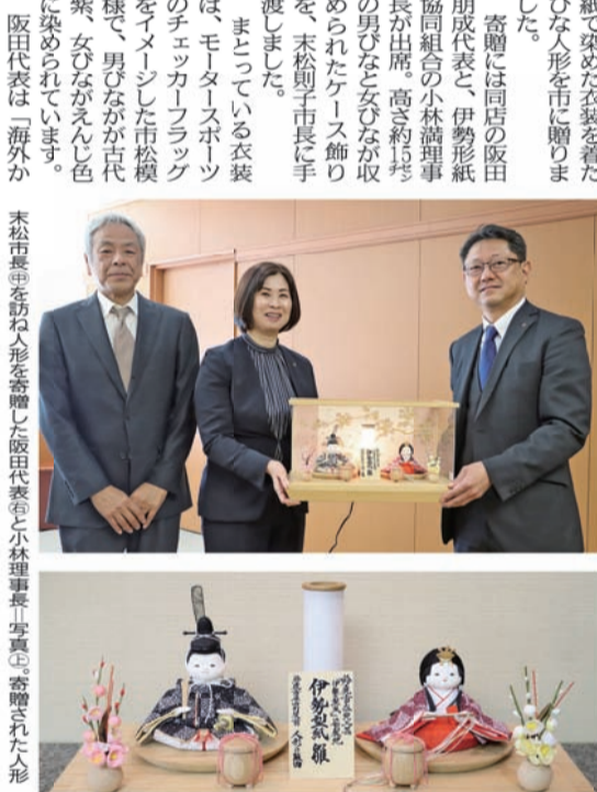
サカタひな人形を市に寄贈した。サカタは、22日に鈴鹿市伝統産業会館で開かれる、鈴鹿小紋サイコンテスト表彰式の会場に展示されるほか、伊勢型紙のイベント開催時に随時公開される予定だ。

ベビー用品と人形の専門店サカタ(鈴鹿市)の伊勢型紙を使用した衣装を着たサカタひな人形を市に寄贈した。サカタは、22日に鈴鹿市伝統産業会館で開かれる、鈴鹿小紋サイコンテスト表彰式の会場に展示されるほか、伊勢型紙のイベント開催時に随時公開される予定だ。