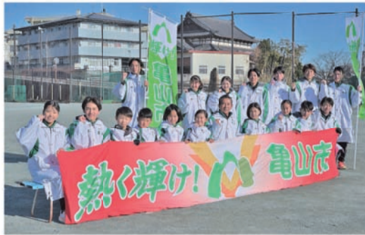
過去最高順位とタイムを狙う亀山市チーム