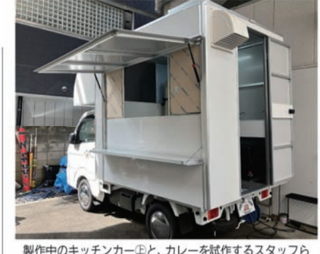
製作中のキッチンカーと、カレーを試作するスタッフら