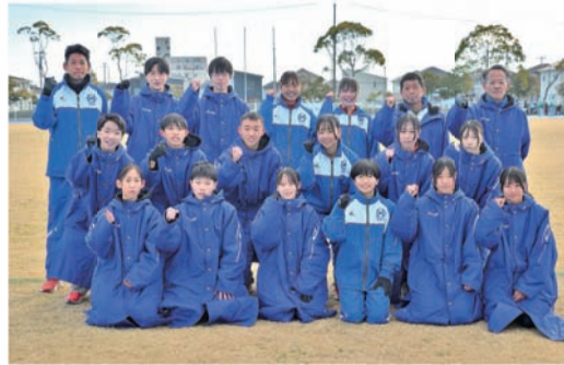
最多5度目の優勝を目指す鈴鹿市チーム