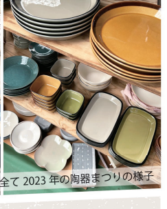
※写真は全て2023年の陶器まつりの様子