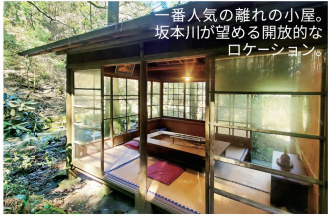
一番人気の隠れの小屋。坂本川が望める開放的なロケーション。

「先代の頃から原種にこだわり、本来の姿やおいしさを保つよう日々試行錯誤をしています。ぜひ坂本川のアマゴの味を楽しんでほしい」