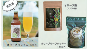
オリーブ グレイス (520円)