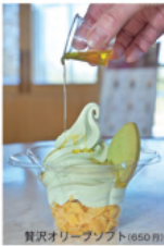
たっぷりオリーブオイルがかかった、爽やかな味のソフトクリーム。

ショップでは、オリーブオイルはもちろん、オリーブやイチゴを使った焼き菓子、調味料、麺などの加工品、雑貨、スキンケア商品などが販売されています。カフェでは、長島産のオリーブやイチゴを使用した季節のグルメやオリジナルスイーツが味わえます。