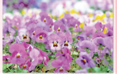
*掲載写真は2023年撮影も含まれています

開園当初有料だった「イングリッシュガーデン」は、無料公開されています。チューリップは30品種約9400球がボランティアによって植栽されました。品種によって開花時期が異なります。どんな花に出合えるでしょう。ガーデンには、バラ、アナベル、スイレン、コキアなどの四季折々を彩る植物も豊富。ぜひ違う季節にも訪れて、移り変わる庭の表情を楽しんでみてください。