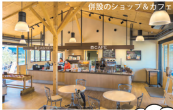
併設のショップ&カフェ

ショップでは、オリーブオイルはもちろん、オリーブやイチゴを使った焼き菓子、調味料、麺などの加工品、雑貨、スキンケア商品などが販売されています。カフェでは、長島産のオリーブやイチゴを使用した季節のグルメやオリジナルスイーツが味わえます。