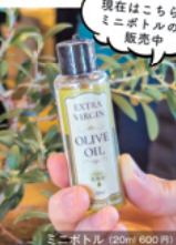
現在はこちらのミニボトルのみ販売中

オリーブの収穫時期である10月下旬頃には、普段は見られない搾油の様子を見学できます。