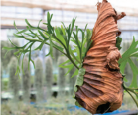
▼人気上昇中の『ピカシダ』も取り扱う。鹿の角のような形をした葉が特徴的。

原種は700種以上、園芸種と合わせると1,000種を超える多彩さが魅力の一つです。土を必要としないため、どこにでも飾ることができ、アレンジの幅も豊富。壁に吊るしたり、ガラスの器に入れたり、 アート や オブジェ を飾る感覚と同様に、自分の好きなスタイルに組み合わせることができます。 育てるインテリア として楽しみながら、エアプランツの魅力に触れてみてください。