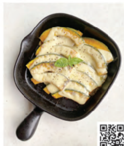
耐熱陶器:グリルプレート/2,640円 TOJIKITONYA(陶古焼)