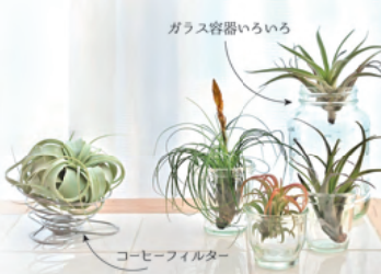
ガラス容器いろいろ