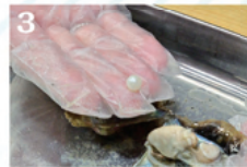
3 美しい真珠が出てきました。今回は追加でアクセサリー加工もします