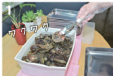
1 アコヤ貝は自分で選べます。どんな色が入っているかはお楽しみ