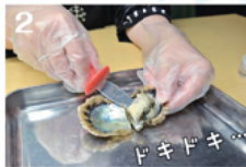
2 ナイフを使って貝を開きます。その後は手の感触で真珠を探して……