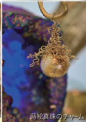
宝飾家の真珠のペンダント