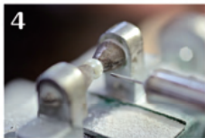
4 穴開けが必要な場合は、スタッフの方が開けてくれます