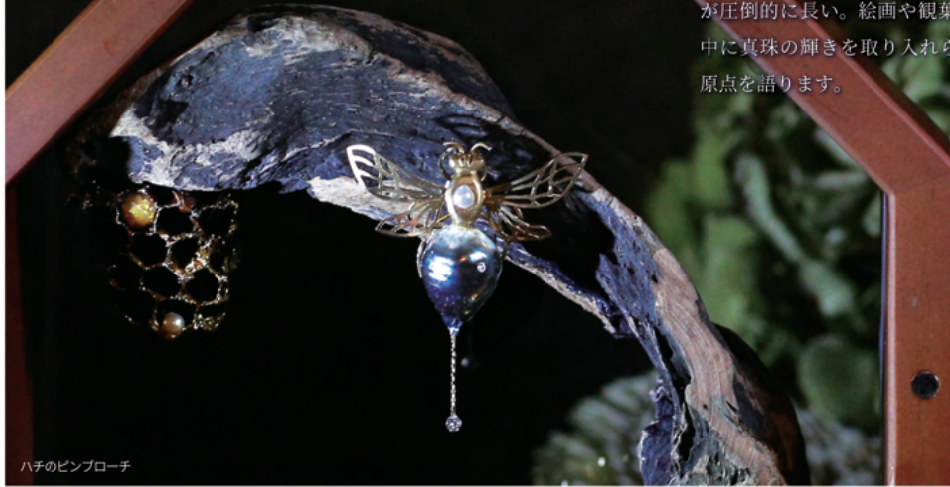
ハチのピンローチ