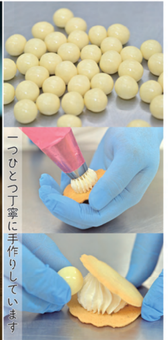
一つひとつ丁寧に手作りしています