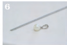
6 ネックレスの完成です。こちらは読者の方に抽選でプレゼント!