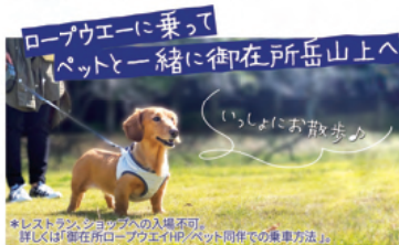
*レストラン、ショップへの入場不可。詳しくは御在所ロープウェイHP「ペット同伴での乗車方法」。