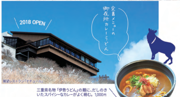
三重県名物「伊勢うどん」の麺に、だしのきいたスパイシーなカレーがよく絡む。1,000円