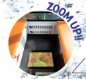
台数限定「床面展望窓」全36両中、10両の Gondola に設置