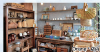
Orang 2 )店内