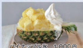
パインナップル氷 1,000円