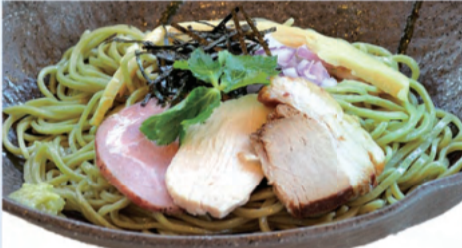
冷やしメカブつけ麺 968円 (和風しょうゆ味)