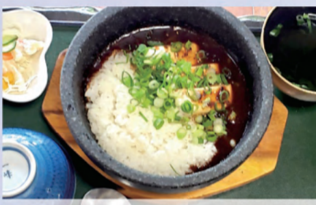
石焼麻婆豆腐膳 1,200円 ランチはコーヒー または ジュース付き