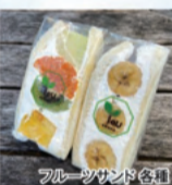
フルーツサンド(各)