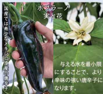
ポブラーノ 実と花

熊野の温暖な気候を生かして育てた唐辛子です。スナック菓子で名をはせたハバネロなど6品種を栽培しています。いずれも国産品は珍しく、輸入品とは一線を画す辛みと品質が、高い評価を得ています。商品の多くは東京へ出荷していますが、一味唐辛子、ソース、ドレッシングなどを公社サイトで販売しています。旬ならではの「生唐辛子」も販売。厳しい暑さを熊野産唐辛子で乗り切って!