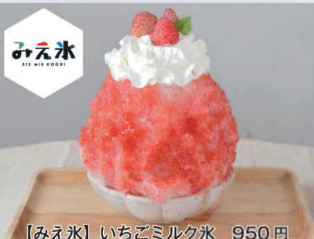
【みえ氷】いちごミルク氷 950円