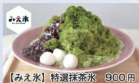
【みえ氷】特選抹茶氷 900円