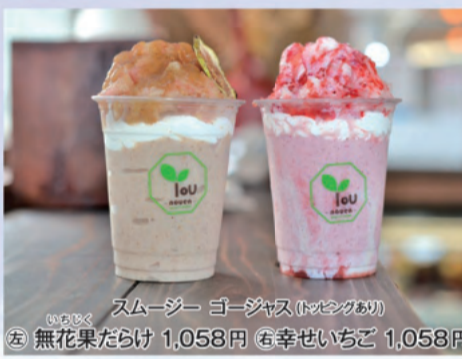
スムージー ゴージャス(トッピングあり) ⑤ 無花果だらけ 1,058円 ⑥ 幸せいちご 1,058円